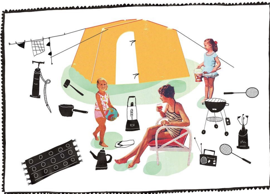
Illustratie Marike Knaapen

De eerste keer kon ik me er nog makkelijk vanaf maken. Een lieve oom en tante hadden hun luxe tent voor ons opgezet. De meisjes, twee en vier, waren onderweg naar Castricum in slaap gevallen. „Waar zijn we?“, vroegen ze toen ik de Volkswagen Polo op het kampeerveldje voor de tent draaide. „In Frankrijk“, zei ik. Waarschijnlijk vooral om het mezelf wijs te maken. Niets zou veranderen. We gingen gewoon met vakantie. Toevallig sprak iedereen hier Nederlands.